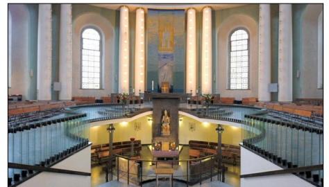
Ansicht des Inneren der St. Hedwigs-Kathedrale

Für eine respektvolle Sanierung der Kathedrale